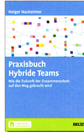
Holger Nauheimer: „Praxisbuch Hybride Teams: Wie die Zukunft der Zusammenarbeit auf den Weg gebracht wird“, Beltz, Weinheim 2022, 203 Seiten, 29,95 Euro